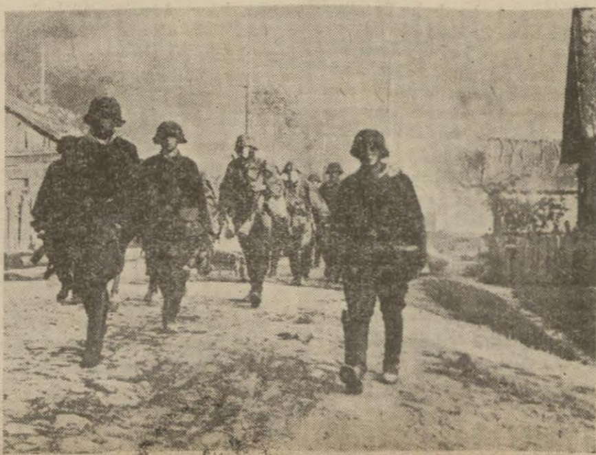
Şark cephesinde Almanlar bir meskûn mahalle girerlerken

kuvvetlice bir deniz filosile, Sidney limanı ve civar ile Madagaskarın Diego Suarez limanına karşı da büyük ve küçük denizaltı gemilerinden mürekkebe denizaltı filolarile yapmış oldukları şaşırtıcı başkım hücumlarıyla ilgili esaslı (Devamı 6 nci sayfada)