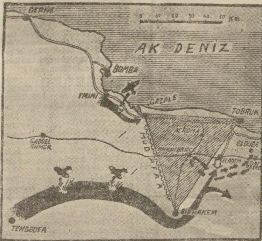
Libyada harekât sahasını gösterir bir harita